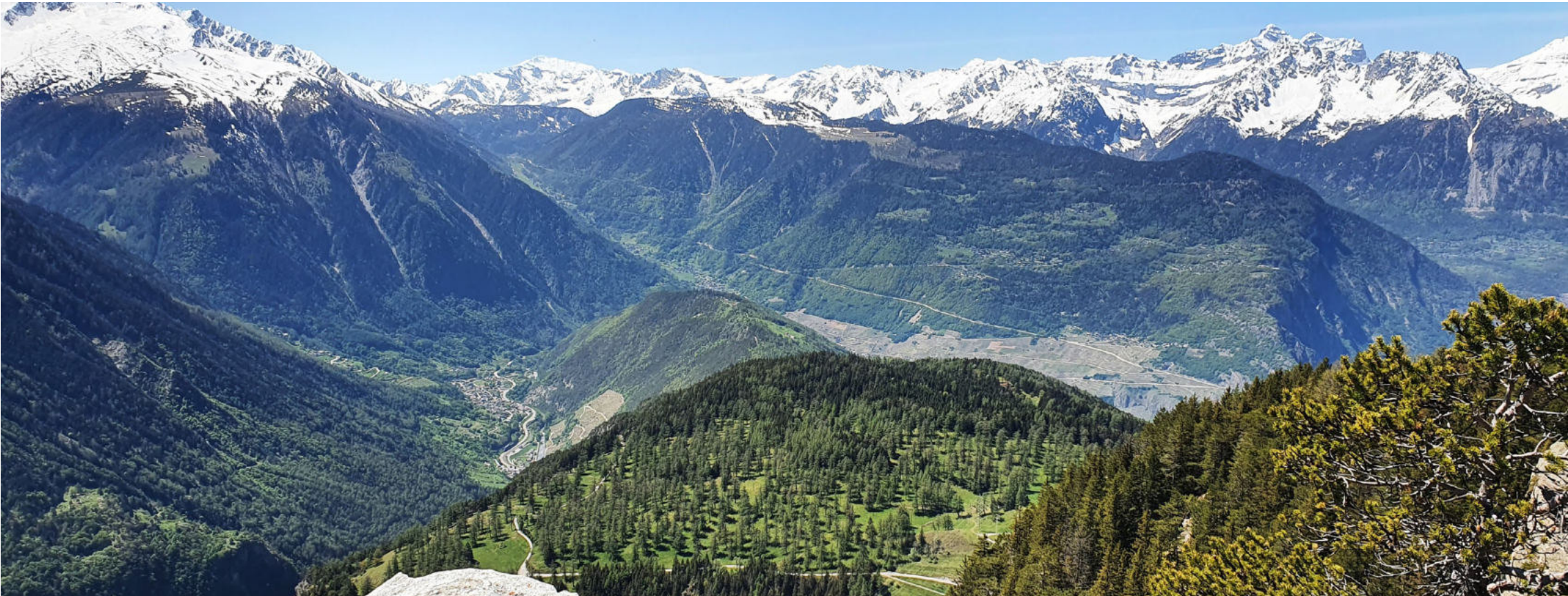
Val d’Entremont - Col des Planches