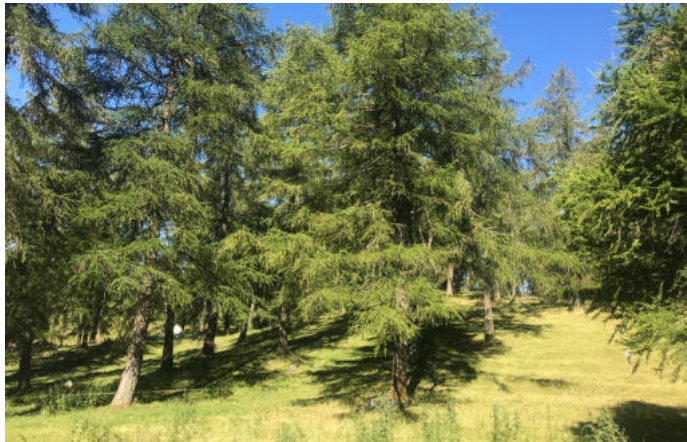
Col des Planches - Mélèzes