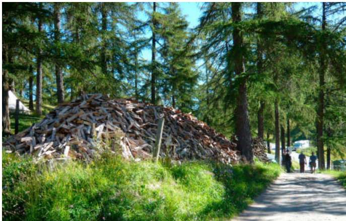
Col des Planches - Exploitation du bois et chemins