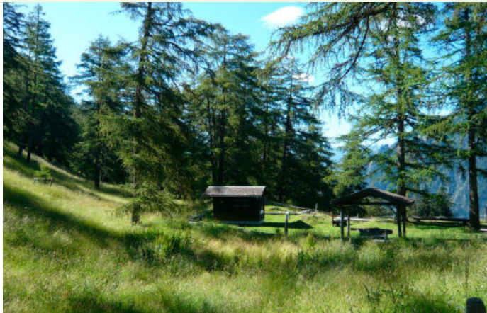
Col des Planches - Structures d'accueil

La présence d'infrastructures impacte le paysage et entre en conflit avec l'entretien de la forêt. Elle mène à des interférences entre exploitation, entretien et tourisme.