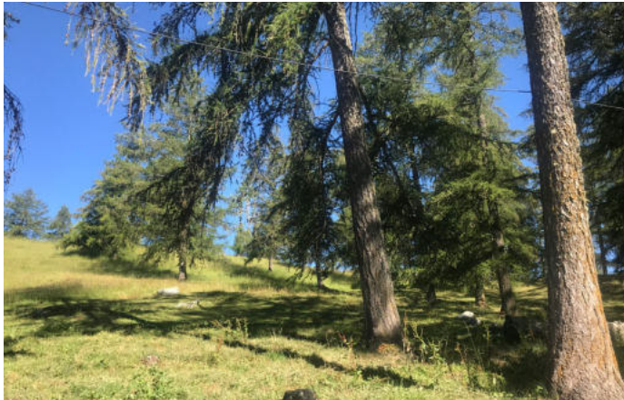
Col des Planches - Clairière