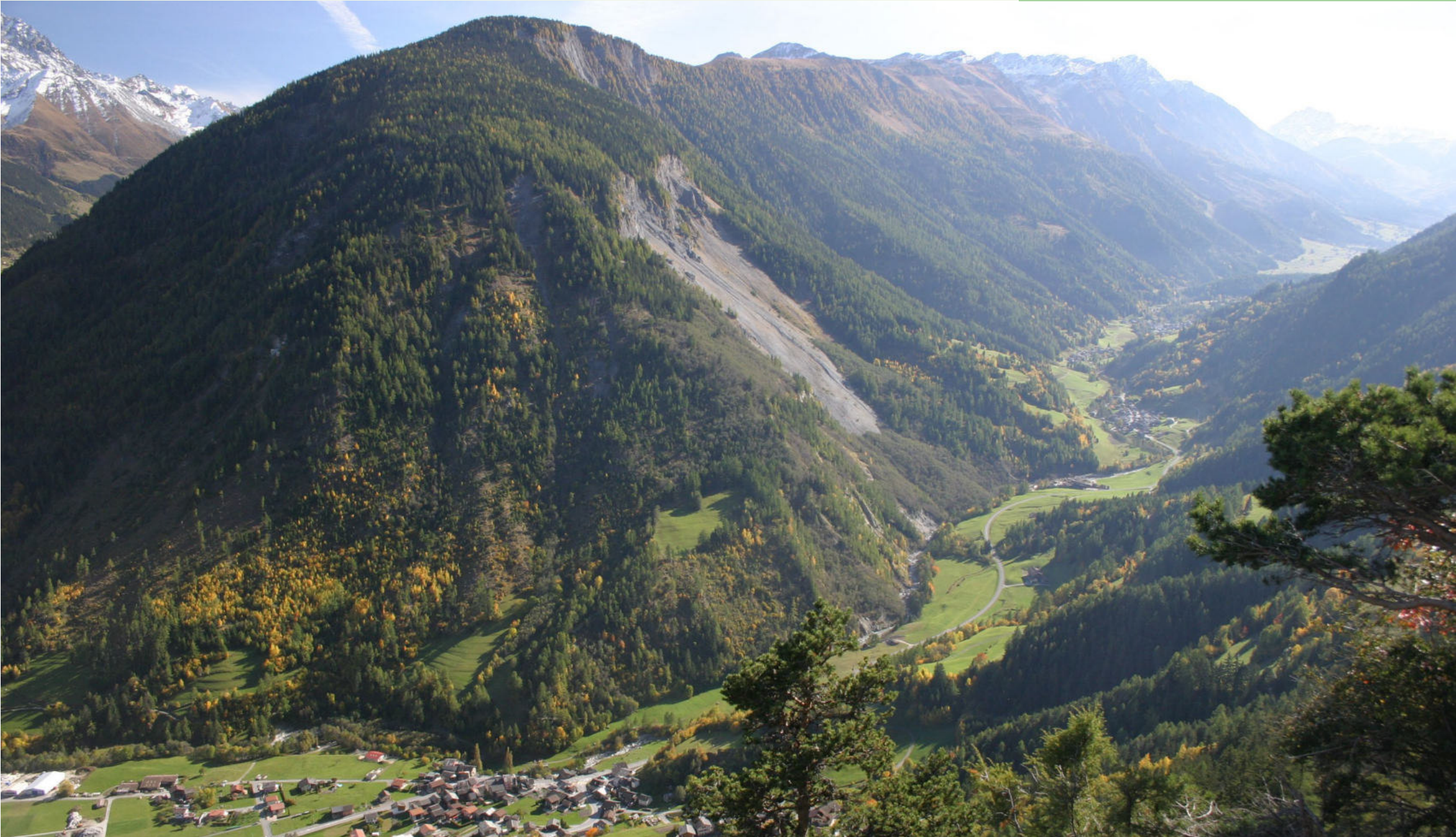
Val Ferret - Différentes topologies de milieux forestiers typiques de vallées latérales

Le paysage forestier dense englobe tous les milieux forestiers dominés par les arbres, qu'ils soient de plaine, de coteaux ou de versants forestiers. Il se distingue par ses quatre fonctions principales : protection contre les dangers naturels, production de matière première durable, protection de la biodiversité et récréation (accueil du public notamment à travers le réseau dense de sentiers pédestres et de lieux de contemplation). La fonction de production répond aux buts d'exploitation et de valorisation du bois (également pour des produits typiques régionaux). On peut remarquer un fort attachement de la population à la forêt, notamment aux fonctions protectrices et de délasserement. La gestion forestière actuelle prend en compte l'évolution de la composition en essences due aux changements climatiques, les effets de ces derniers sur la stabilité et la santé des massifs forestiers ainsi que leur impact sur la réalisation des fonctions forestières nécessaires à la population. Les connexions entre les milieux naturels assurées par le paysage forestier remplissent la fonction de protection de la