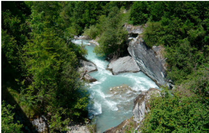
La Luette dans le Val d'Hérens