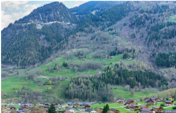
Val de Bagnes - Anciens pâturages abandonnés, reboisés d'épicéas et de mélèzes, ainsi que différentes friches plus récentes de feuillus divers dans les mayens en amont