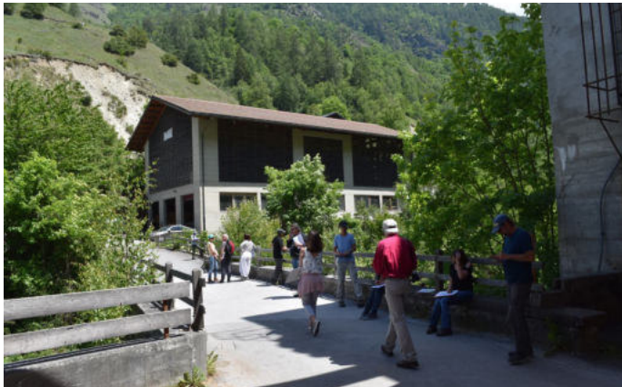
La Luette dans le Val d'Hérens