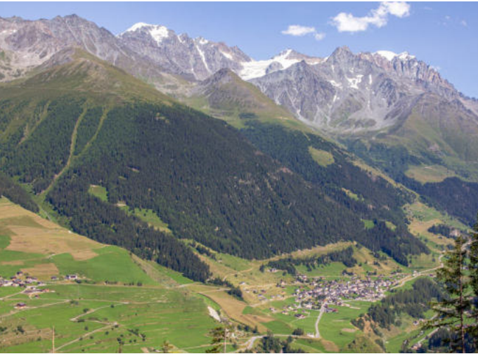
Village de Liddes - Route internationale du Grand-St-Bernard et forêt protectrice de la Lantse