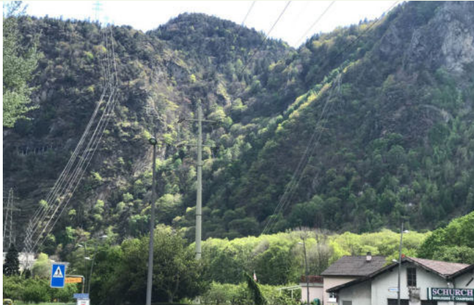
Vernayaz - Différentes lignes à haute tension

La forêt est très prisée pour de nombreuses activités de loisirs, ce qui peut nuire à la flore et à la tranquillité de la faune.