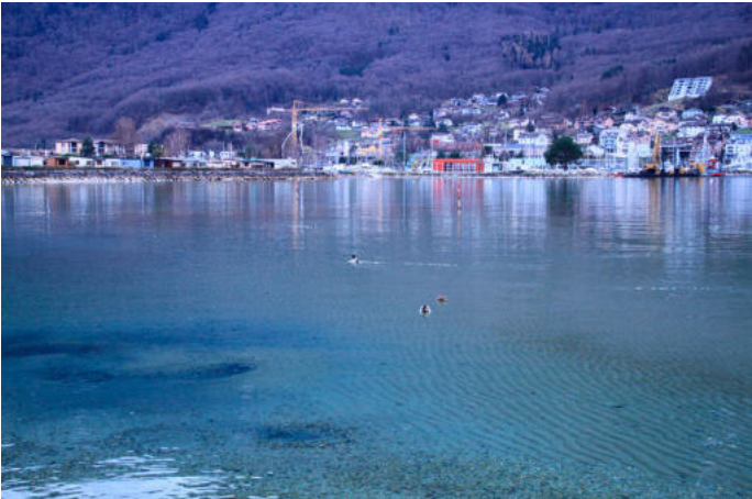
Rives du Léman