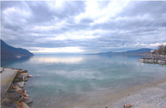
Rives du Léman