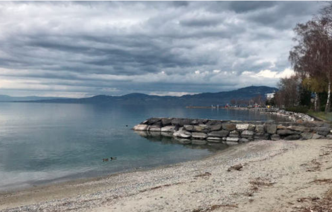
Port-Valais - Rives de loisirs