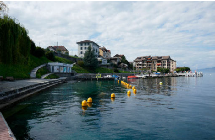
St. Gingolph - Rives