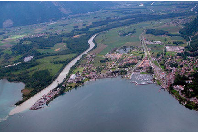
Rives du Léman