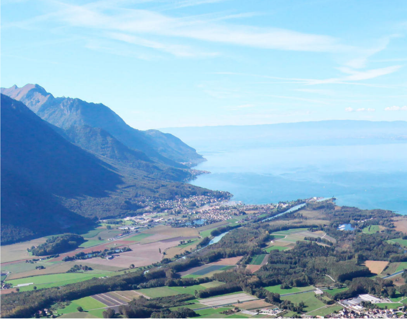
Rives depuis la plaine